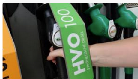
HISWA-RECRON Veel te weinig HVO-stations op het water

Het aantal waterstof tankstations aan het weg is nog zeer beperkt laat staan aan het water.